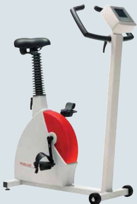
SCHILLER ERG 910S

Новые велоэргометры SCHILLER работают практически бесшумно, не требуют специального технического обслуживания и очень простые в эксплуатации.