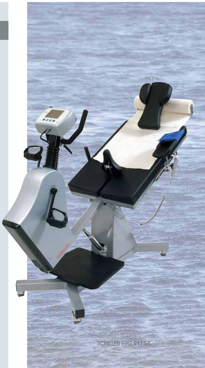
SCHILLER ERG 911 S/L

Он подходит для нагрузочного тестирования и тестирования с использованием катетера в кардиологии и восстановительной медицине, у пациентов группы риска, пожилых или физически ослабленных пациентов.