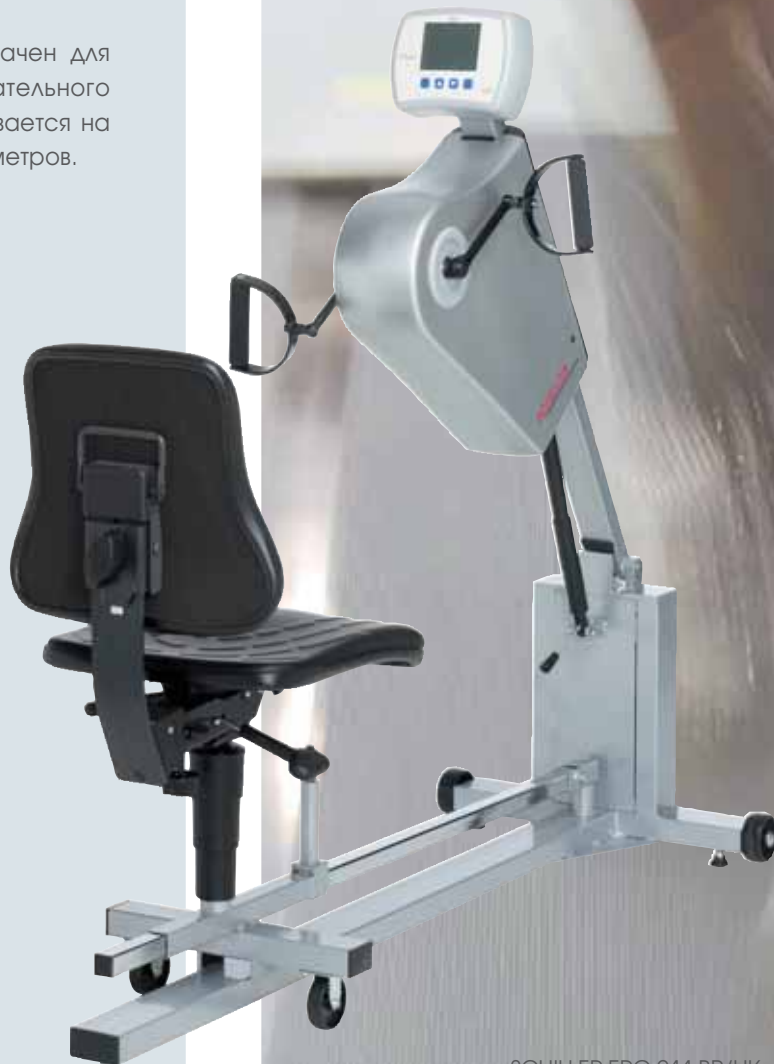
SCHILLER ERG 911 BP/НК

Новый ручной эргометр SCHILLER предназначен для пациентов с нарушениями опорно-двигательного аппарата. Эта специальная версия основывается на проверенных технологиях других наших эргометров.