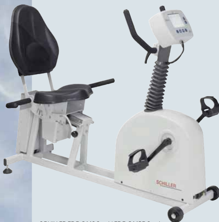
SCHILLER ERG 911S Seat/ ERG 911BP Seat

Сидячие эргометры SCHILLER для тестирования пациентов с большим весом