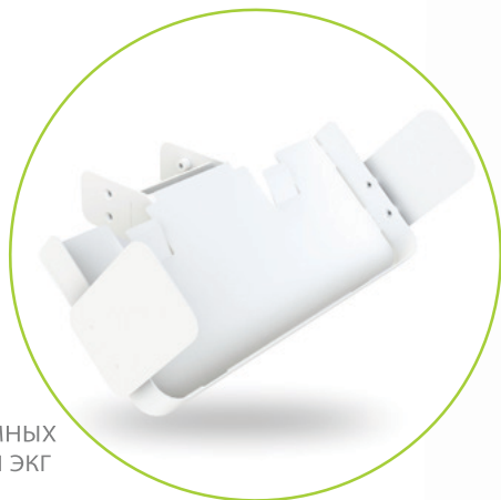
ПОЛКА ДЛЯ ЗАРЯДНОГО УСТРОЙСТВА MESI mTABLET